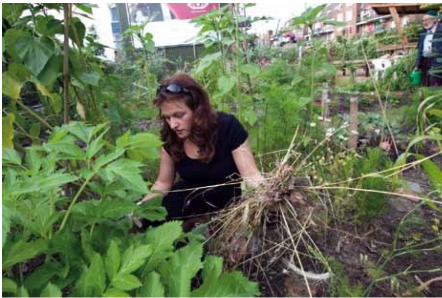
Vrijwilligster op de Tussentuin