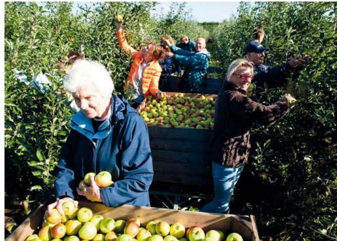
Appelooft op de Buytenhof

Op vrijwel alle Rotterdamse buurttuinen zijn mensen met een niet-Nederlandse achtergrond actief. Met de Tuin aan de Maas als enige uitzondering. Mensen met een niet-Nederlandse culturele achtergrond zijn nu eenmaal dun gezaaid op de Müllerpier. Overigens komen er wel eens mensen uit Schiedamse Oogst op. Dat mag, al wordt er wel bij gezegd dat het dan wel min of meer de bedoeling is dat men wat terug doet voor de tuin. En ook dat gebeurt. In het Schiebroekse stadslandbouwproject nemen