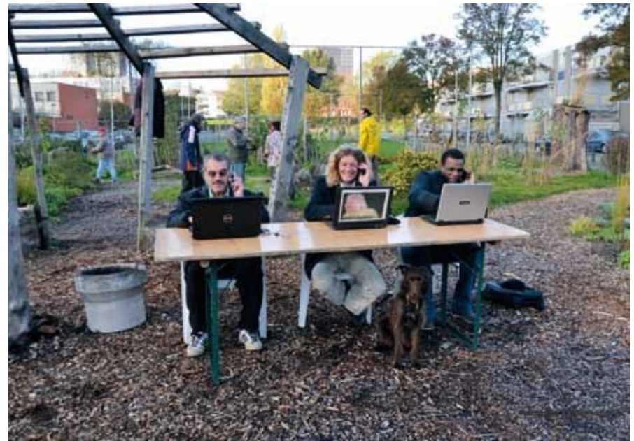
Kantoor op de Afrikaandertuin

om werklozen uit wijk A zo'n participatiebaan aan te bieden in wijk B. En andersom. Mensen voelen zich anders 'te zeer bekeken', zoals een SDW-medewerker het uitdrukte. Bovendien, zo voegt een medewerker van voorheen SoZaWe hier aan toen: 'De straatjeugd weet deze mensen maar al te goed te vinden. Soms worden ze simpelweg gepest. Dit moet je niet willen.'