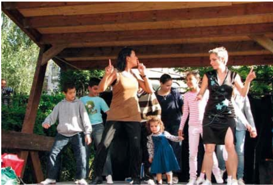
Tapdance workshop op de Tussentuin

Er zijn een paar initiatieven waar gezondheid wel een expliciet doel is. Bijvoorbeeld bij de Voedseltuin . Daar is het streven immers de klanten van de Voedselbank verse en dus gezonde groenten en fruit aan te bieden.