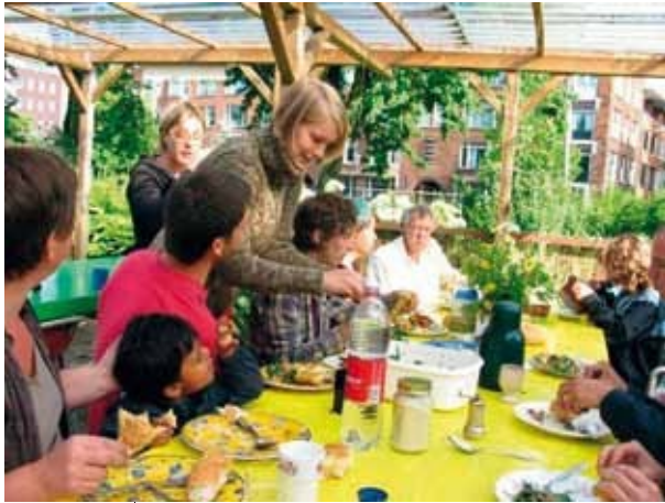
Samen eten op de Gandhituin

Als de start lukt gaat de rest wel overal zo goed als vanzelf.