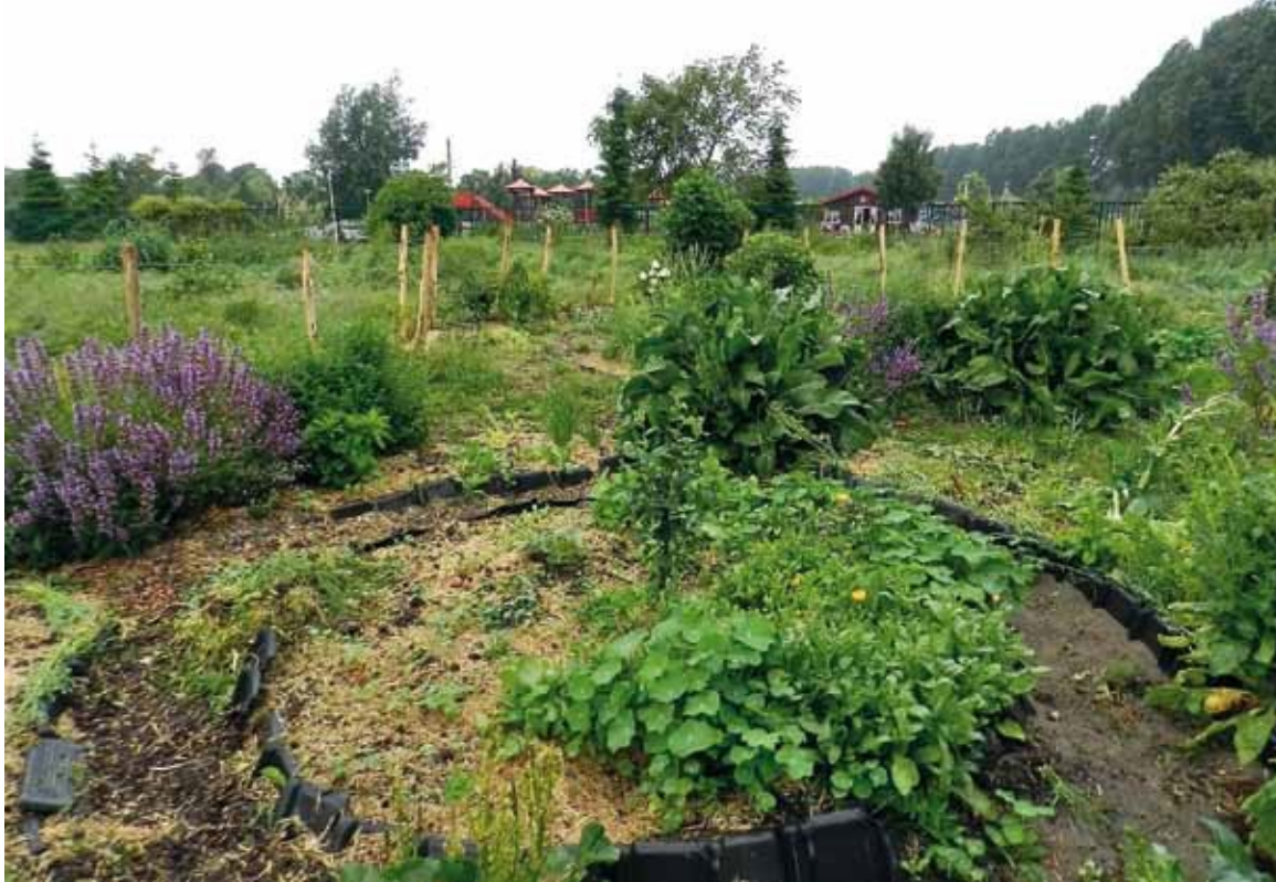
Permacultuur kruidenspiraal Wollenfoppengroen & co

afbreken van bepaalde afvalstoffen. Permacultuursystemen kunnen ook bescherming bieden tegen (...) wind en water.