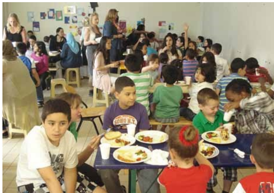
Samen eten op OBS Bloemhof