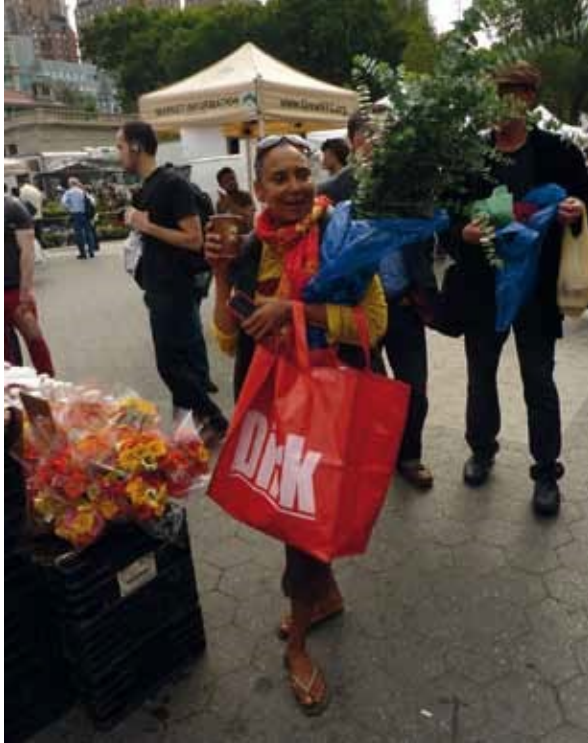
Surinaamse dame op boerenmarkt, Union Square, New York City

Een van de problemen is de betaalbaarheid van de lokaal geproduceerde producten. 89 Er zijn drie groepen te onderscheiden: de reeds overtuigden , die zich duurder voedsel ook kunnen veroorloven; degenen die nog overtuigd moeten worden en de mensen die het zich niet kunnen veroorloven om op bio- en boerenmarkten inkopen te doen. In de VS is voor die laatste categorie een systeem bedacht waardoor mensen die de zogenaamde foodstamps gebruiken het recht hebben om op boerenmarkten extra voordelig in te kopen. 90 Het zou te overwegen zijn om via een vergelijkbare regeling – bijvoorbeeld via de Rotterdampas - de Rotterdamse bio- en boerenmarkten voor uitkeringsgerechtigden en andere minder kapitaalkrachtige Rotterdammers toegankelijker te maken. De belangrijkste reden om geen duurzaam geproduceerd voedsel te kopen is vaak de prijs, zo blijkt uit onderzoek. 91